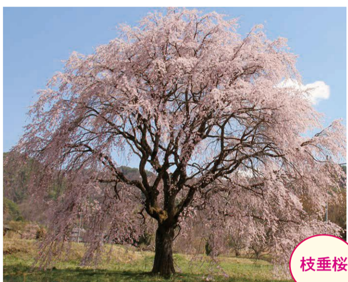
25 小野子・北沢孝臣家の畑 (県道沿い) ●幹周り: 1.8m ●樹高: 13.0m