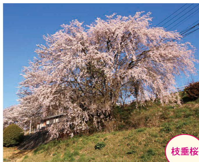
6 中宮・福与勇夫宅前 [右] ●幹周り: 1.77m ●樹高: 12.0m [左] ●幹周り: 2.35m ●樹高: 12.0m