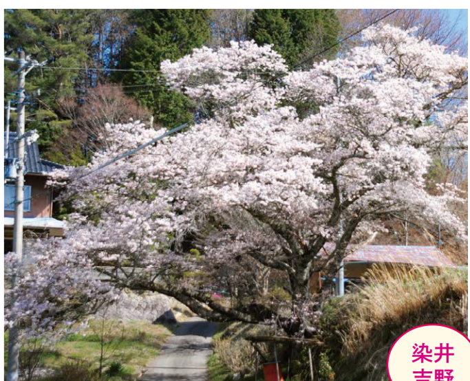
28 蛇沼・塩沢万寿夫宅 ●幹周り: 4.1m ●樹高: 11.0m