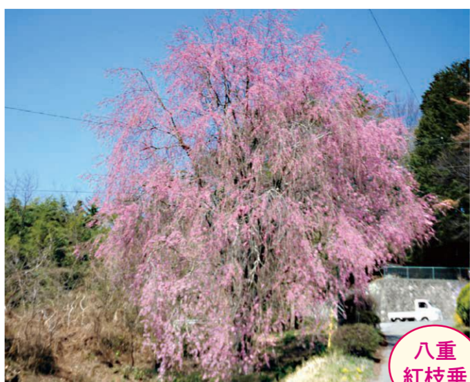
28 蛇沼・塩沢万寿夫宅 ●幹周り: 4.1m ●樹高: 11.0m