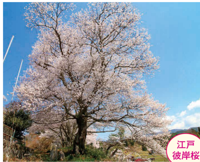
7 中宮・お観音 ●幹周り: 3.07m ●樹高: 15.0m