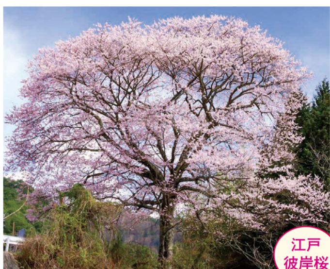
19 森・木下吉幸宅の上道沿い ●幹周り: 2.7m ●樹高: 18.0m