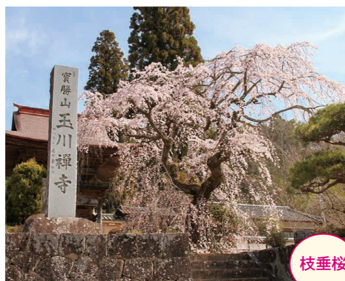
16 越久保・川手寛家の墓地 (樹齢400年位) [桜] ●幹周り: 5.1m ●樹高: 12.0m [木蓮] ●幹周り: 2.5m ●樹高: 20.0m