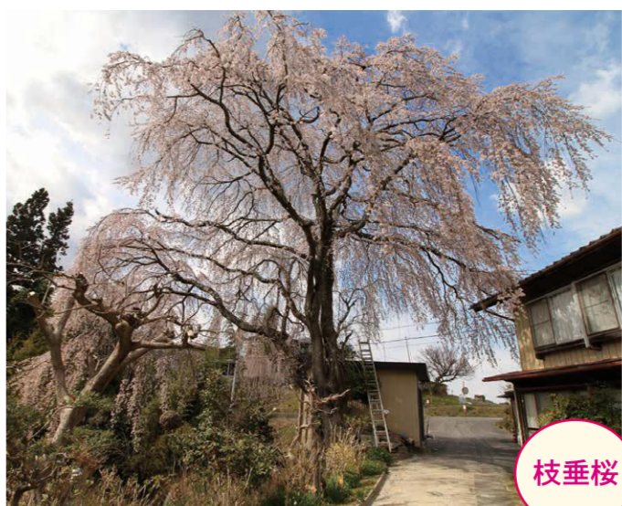
17 風張・川手勝美宅 ●幹周り: 2.7m ●樹高: 12.0m