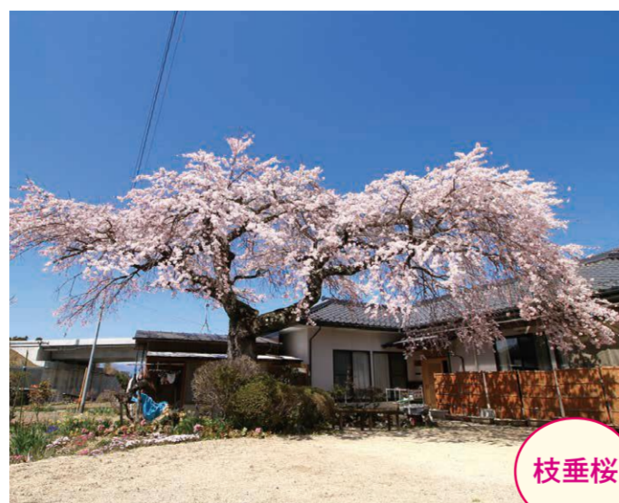
9 上平・柴田千代子宅 ●幹周り: 2.0m ●樹高: 6.0m