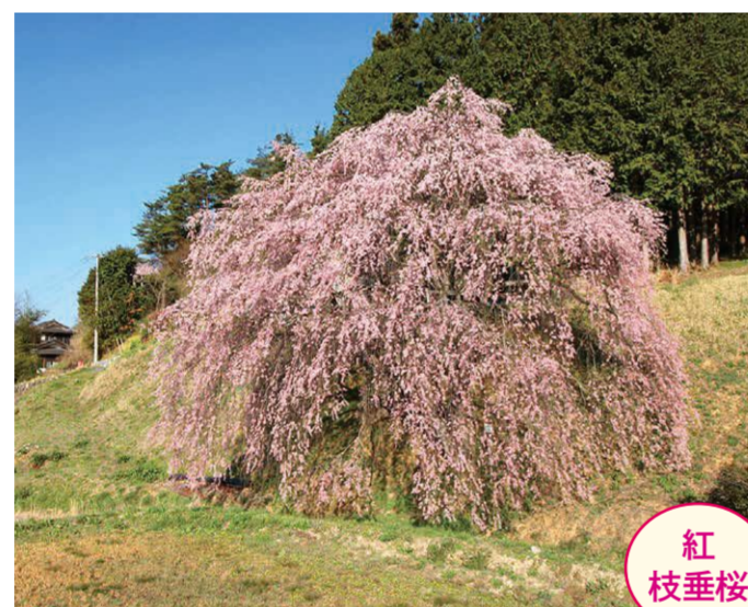
4 原平・久保田賢司家の土手 (西屋初代又六の桜) ●幹周り: 2.1m ●樹高: 15.0m