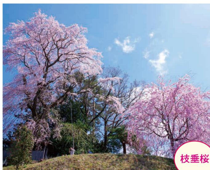
14 越久保・後藤良郎家氏神様 (法現坂) ●幹周り: 3.7m ●樹高: 15.0m