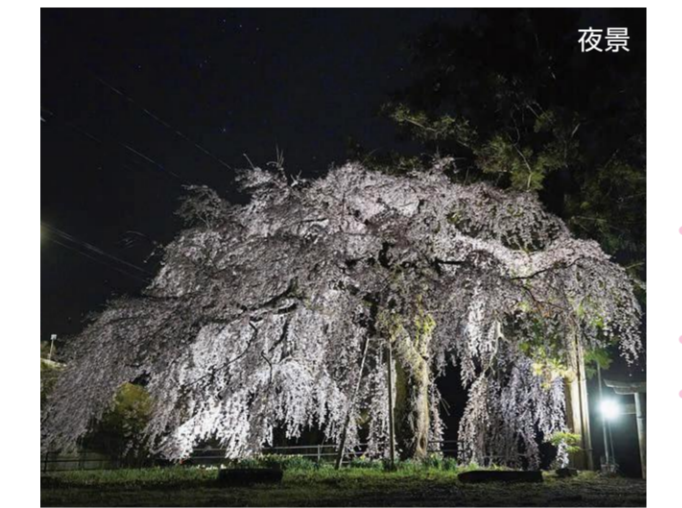
8 中宮・久堅神社 境内 (西屋初代又六の桜)