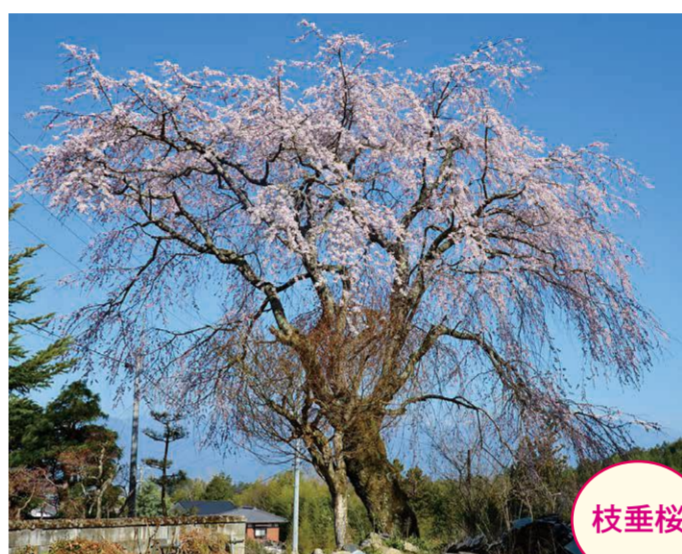
13 越久保・鈴木千津子宅 (さよさ桜) ●幹周り: 2.7m ●樹高: 13.0m