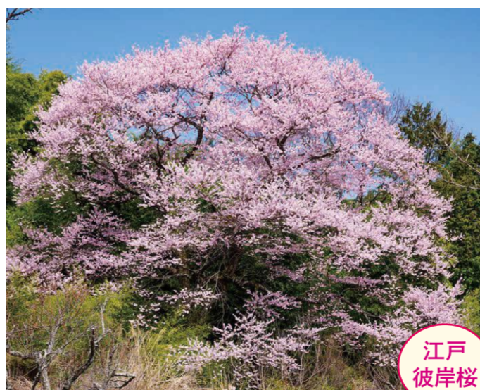
15 越久保・後藤明弘家の畑 ●幹周り: 2.66m ●樹高: 14.0m