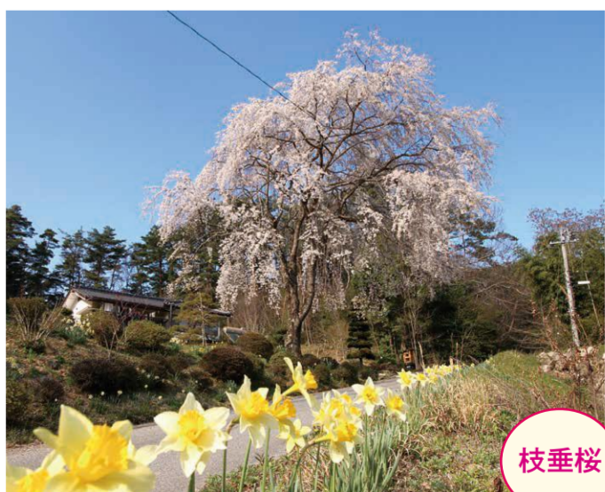
21 堂平・塩沢美弘宅 (櫻垣外の枝垂桜) ●幹周り: 1.95m ●樹高: 9.0m