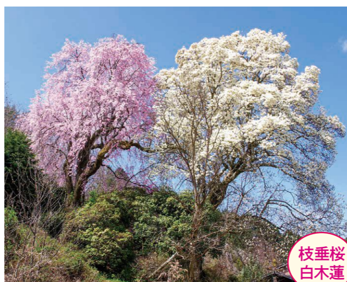
22 堂平・中山将英宅 ●幹周り: 2.0m ●樹高: 11.0m