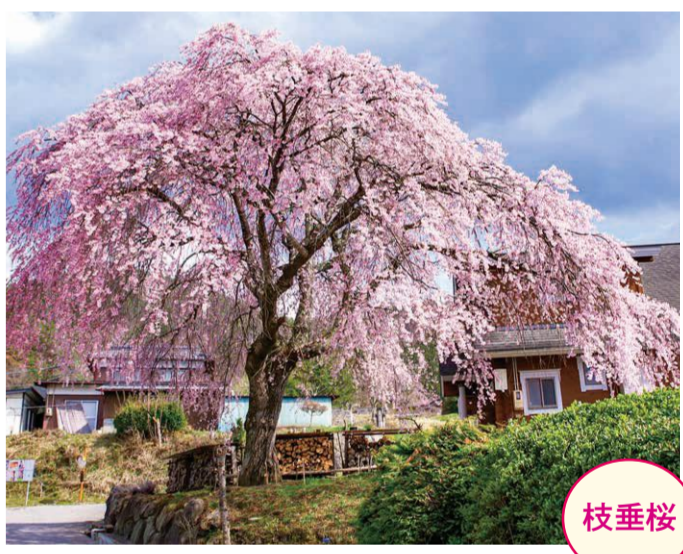
26 小野子・北沢正明宅 ●幹周り: 2.65m ●樹高: 11.0m