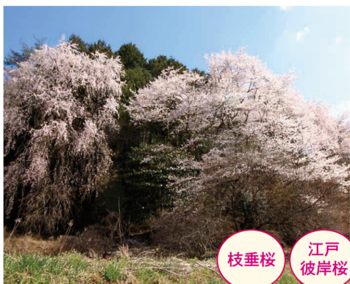
20 大鹿・松枝利雄宅前 [江戸彼岸桜] ●幹周り: 1.85m ●樹高: 16.0m [枝垂桜] ●幹周り: 2.6m ●樹高: 21.0m