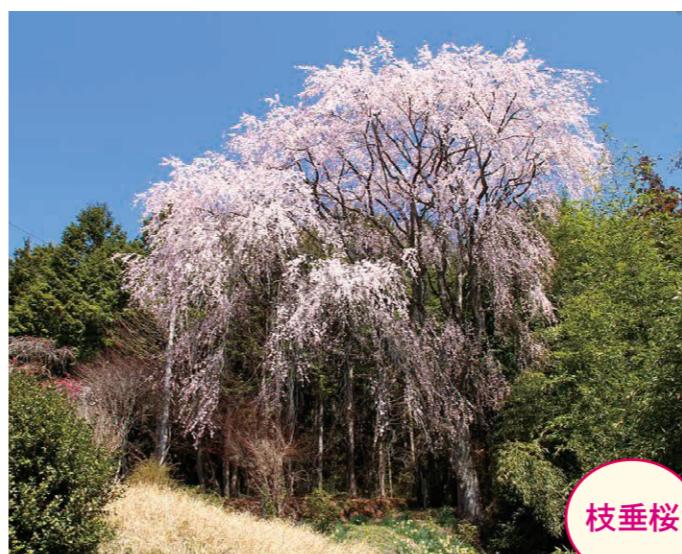
11 上平・井の口桜 (樹齢250年位) ●幹周り: 2.06m ●樹高: 22.0m