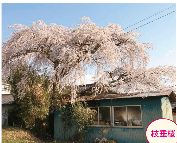
23 小野子・北沢孝文宅 ●幹周り: 3.6m ●樹高: 10.0m