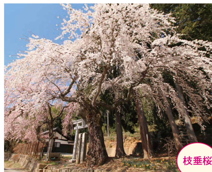
1 原平・山之神社 境内 [右] ●幹周り: 2.05m ●樹高: 10.0m [左] ●幹周り: 2.15m ●樹高: 10.0m