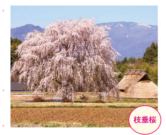
5 原平・北田遺跡 ●幹周り: 2.5m ●樹高: 10.0m