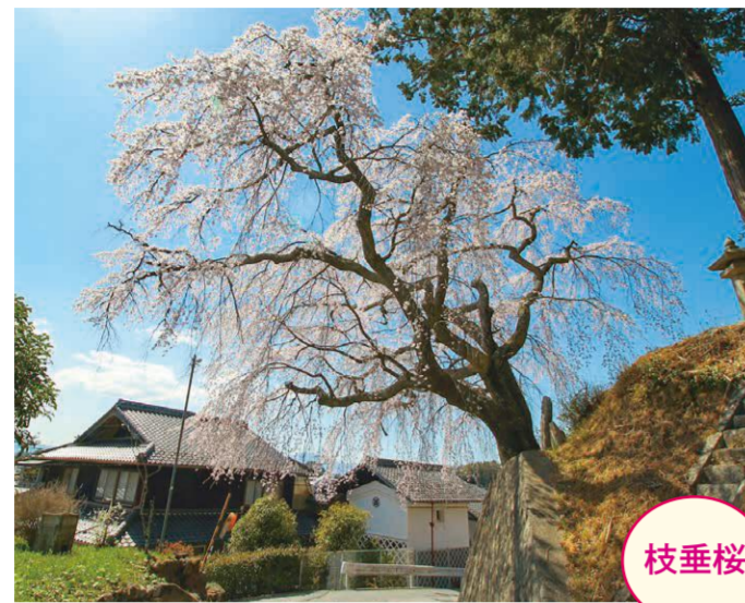
2 原平・長谷部勝典家の墓地 ●幹周り: 3.2m ●樹高: 12.0m