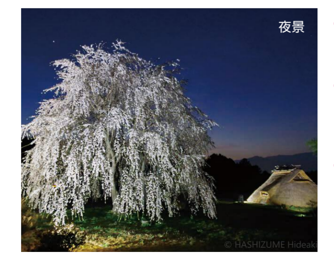
10 上平・玉川寺 山門 ●幹周り: 2.0m ●樹高: 7.0m