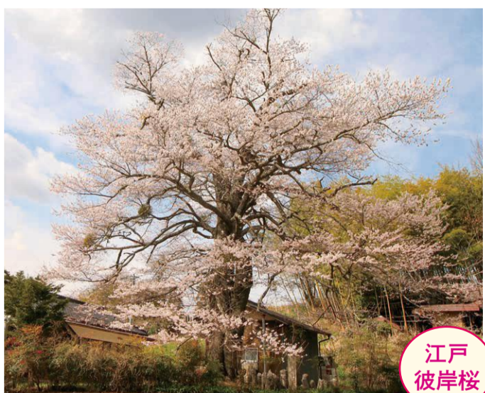
27 落倉・落倉集会所 (樹齢400年位) ●幹周り: 4.2m ●樹高: 18.0m