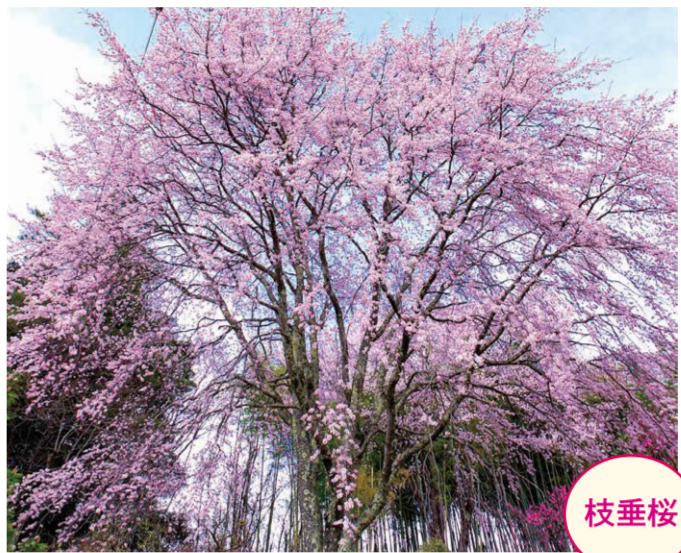
18 森・木下博文家の畑 ●幹周り: 2.7m ●樹高: 17.0m