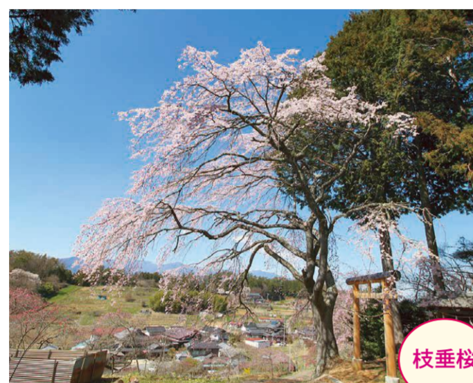
3 原平・長谷部一統の氏神様 ●幹周り: 2.2m ●樹高: 12.0m