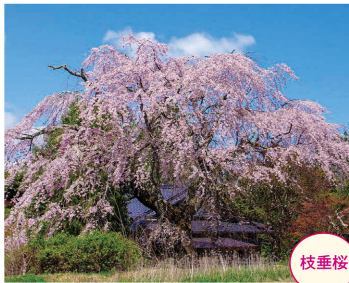
12 上平・吉沢悦子宅 (古寺の桜) ●幹周り: 2.2m ●樹高: 10.0m