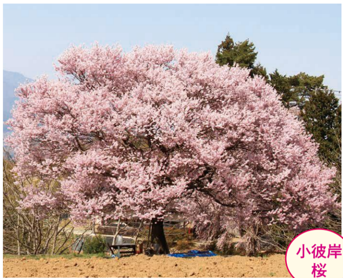
24 小野子・小野子人参の畑 ●幹周り: 1.9m ●樹高: 10.0m