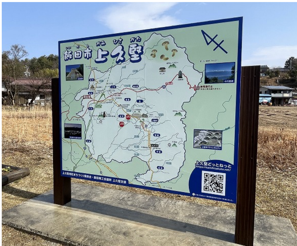
コンパクトにリニューアルされた観光案内看板